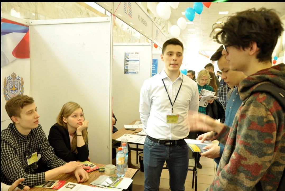
Абитуриентов консультировали студенты Аэрокосмического факультета