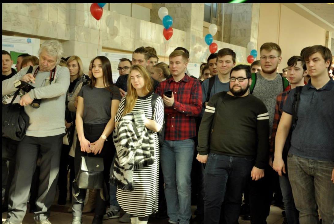
На выставке – представители работодателей, студенты целевого набора, школьники