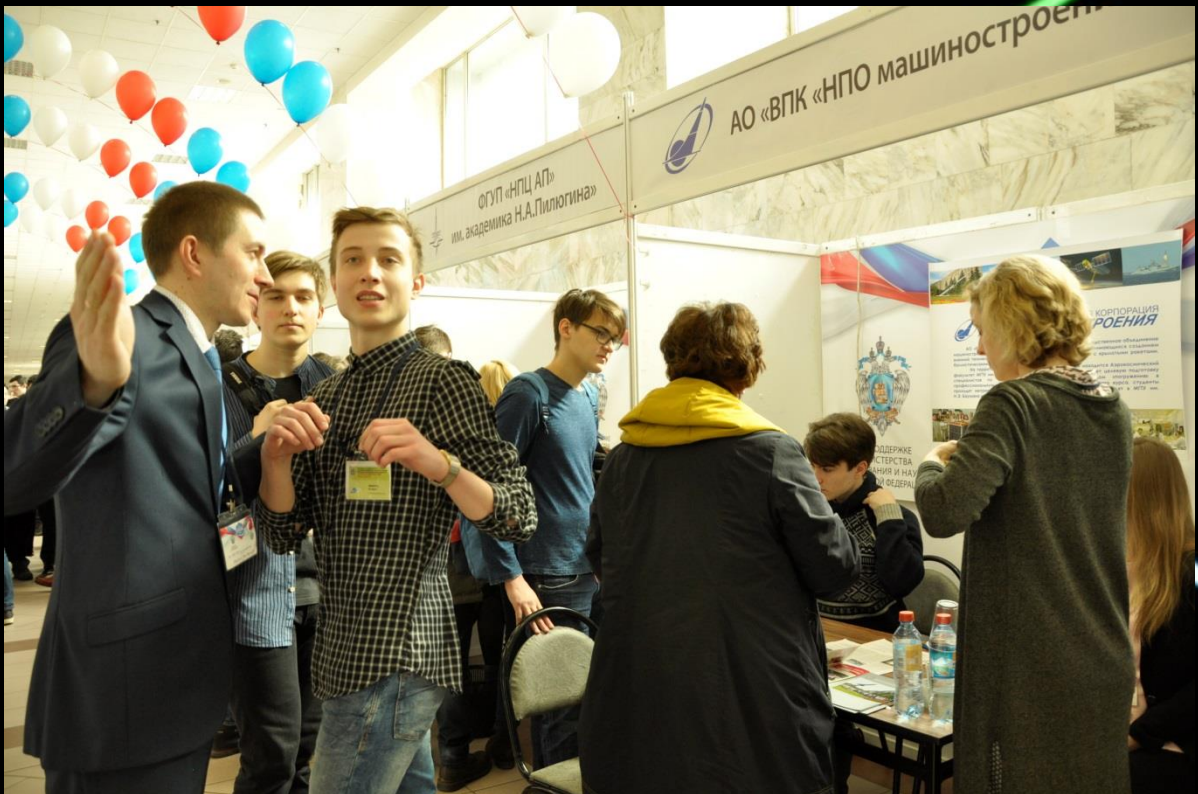
Ответственный секретарь Отборочной комиссии управлял работой консультантов