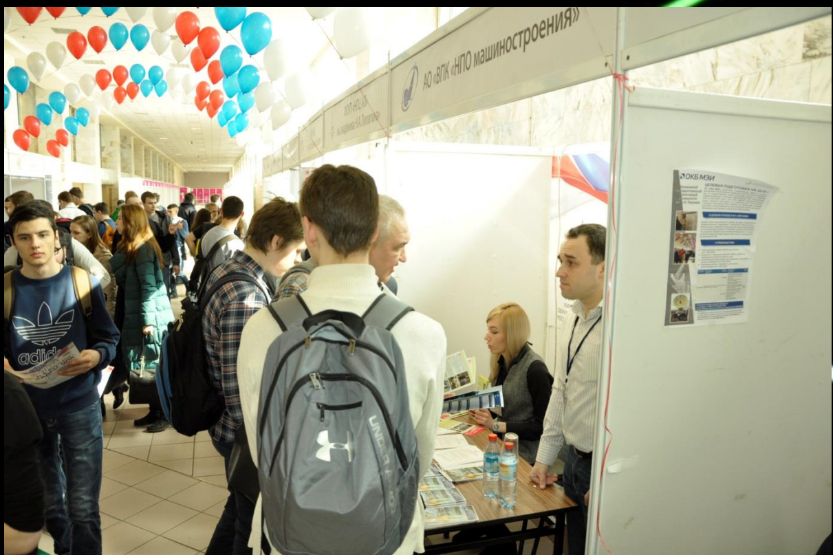
АО «ВПК «НПО машиностроения» представляли Главный технолог и отдел кадров